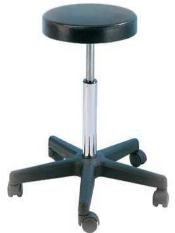
Piètement polyamide Réf. 3500N