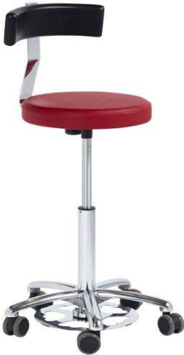
Tabouret à commande au pied Roues Ø 65 mm pied chromé Réf 3850R