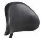
Dossier Tulipe Réf. 3700