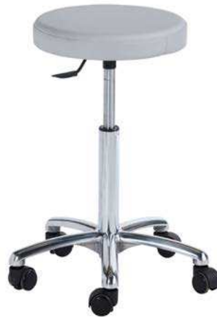
Piètement alu Réf.3600G AUTOF